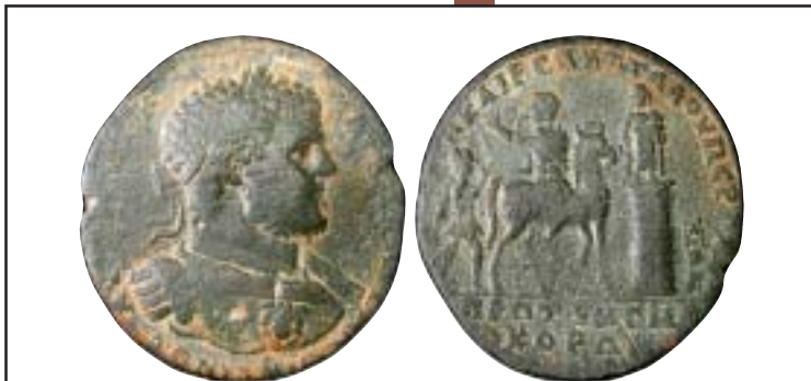
MONNAIES XXI, n° 2821 RR, médaillon, TB+, 750 €