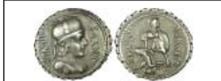
MONNAIES XXI, n° 2172 Rare, superbe, 300 €