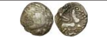
MONNAIES XX, n° 232 Electrum, RRR 800 €