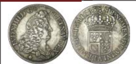
MONNAIES XX, n° 484 Rare, important, 1000 €