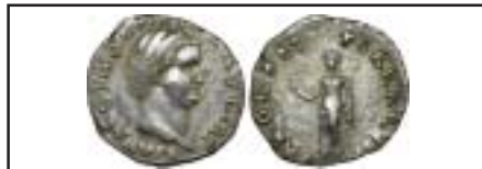
MONNAIES XXI, n° 2377 OTHON, TTB+, 1200 €