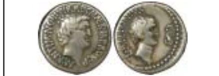
MONNAIES XXI, n° 2277 RRR, TTB, 750 €