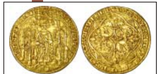
MONNAIES XX, n° 766 Pavillon d'or du Prince Noir, 4800 €