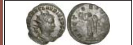
MONNAIES XXI, n° 3210 Troisième connu, TTB, 950 €