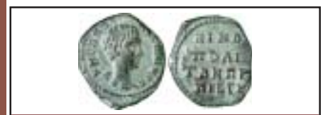
MONNAIES XXI, n° 2872 Inédit, Diaduménien, SUP, 150 €