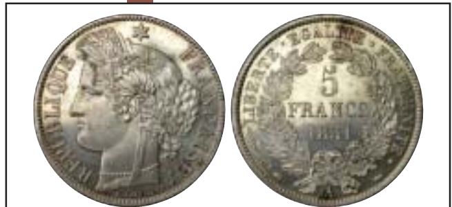
MONNAIES XX, n° 1147 SPL 63, l'exemplaire CI, 480 €