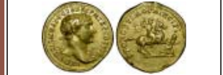
MONNAIES XXI, n° 2451 RARE, intéressant, TTB+, 3200 €