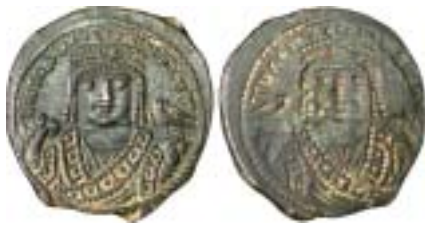
MONNAIES XX, n° 113 Fauté, RRR comme fauté, 200 €