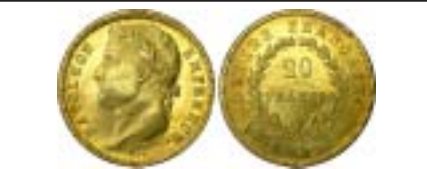
MONNAIES XX, n° 917, SPL 63, ordres à 990 et 850 enregistrés sur des pièces identiques : 450 €